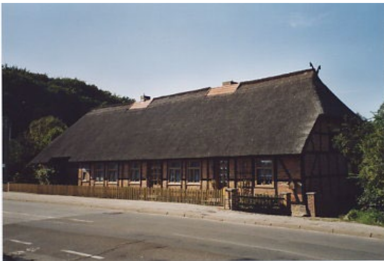
Schwerin, OT Mueß