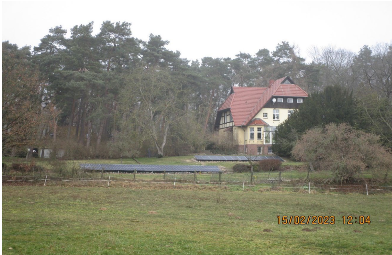
Güstrow, Heidbergweg © LAKD M-V/LD.

Standortfrage: Alternativen zum Denkmal: Freifläche oder Nebengebäude