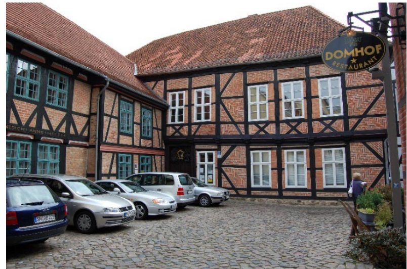
Schwerin, Domhof