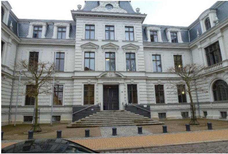
Schwerin, Puschkinstr.