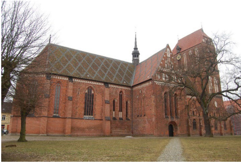
Güstrow, Dom