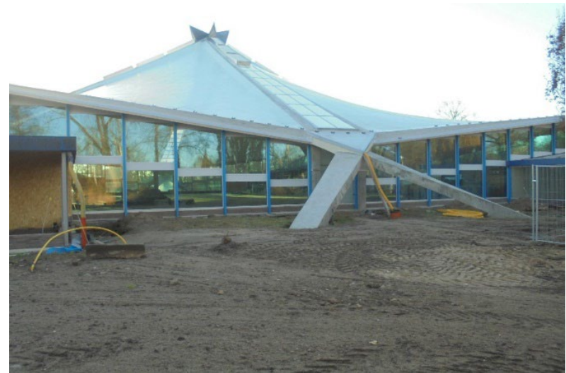
Neubrandenburg, Stadthalle © LAKD M-V/LD.