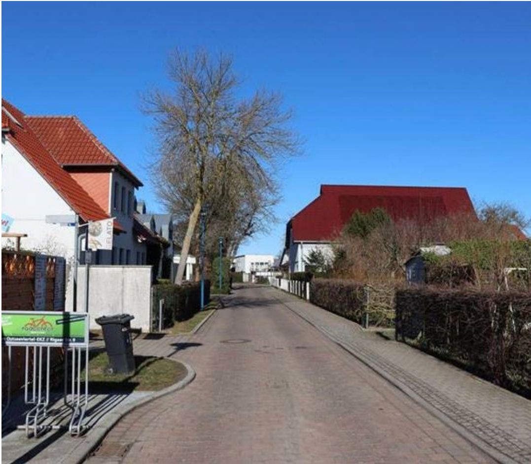
Greifswald OT Wieck © LAKD M-V/LD.

Farbangepasste rote Glasfläche auf ziegelroter Dachfläche im Denkmalbereich