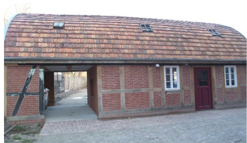
Schwerin, Gr. Moor © LAKD M-V/LD.