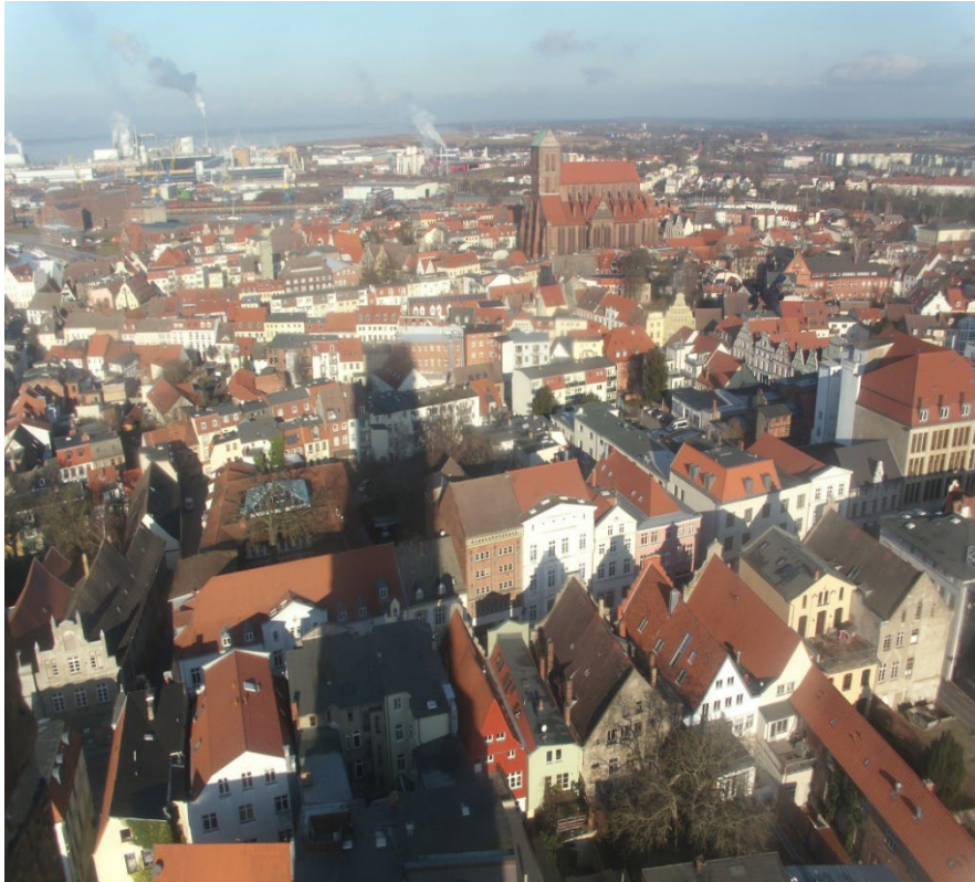
Wismar, Luftbild