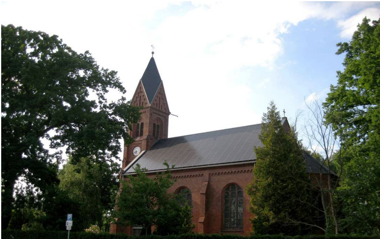
Greifswald OT Wieck © LAKD M-V/LD.