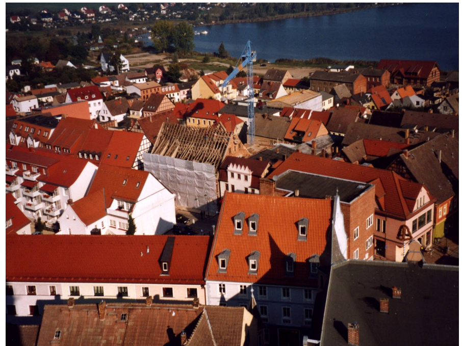
Wolgast, Luftbild