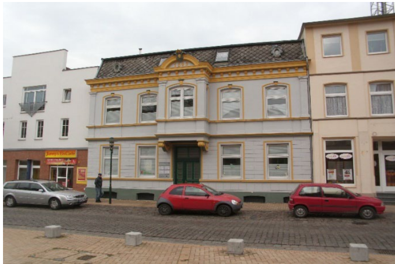
Grevesmühlen, A.-Bebel-Str.