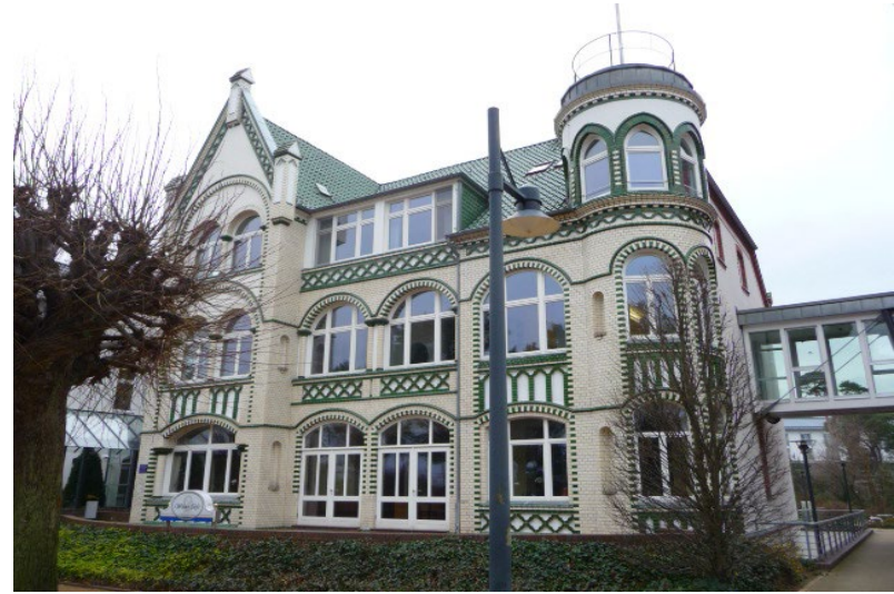
Bansin, Bergstr.